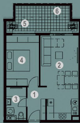
NETO POVRŠINA ZA STAN S.2.41.