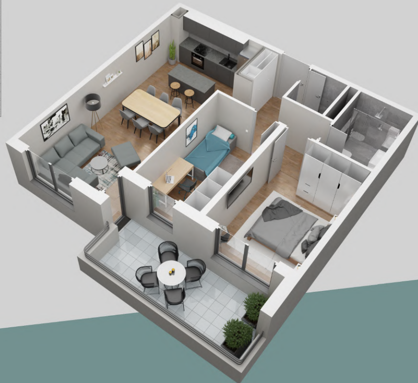
NETO POVRŠINA ZA STAN S.2.38.