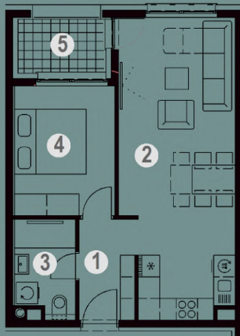
NETO POVRŠINA ZA STAN S.1.26.