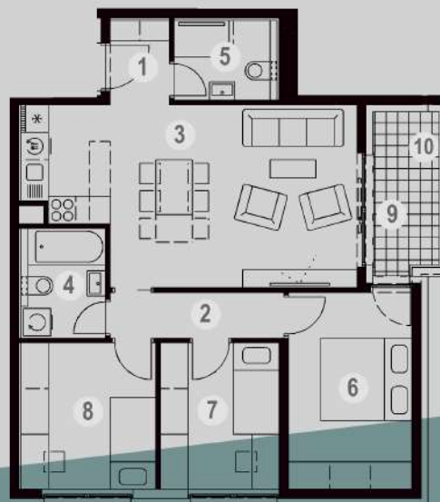
NETO POVRŠINA ZA STAN S.1.20.