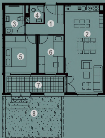
NETO POVRŠINA ZA STAN S.0.07.